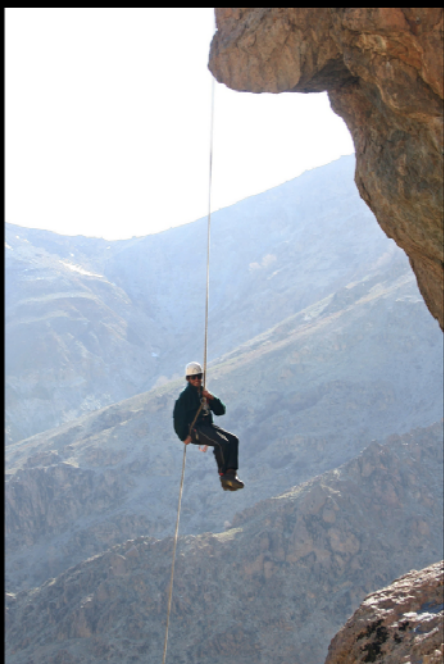
(عکس تزیینی)