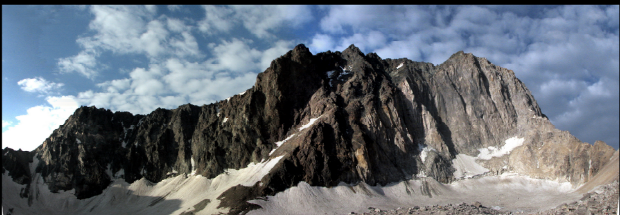
پانورامای منطقه علم کوه