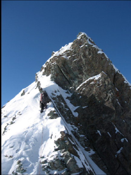
عکاس: مجتبی کیانی (عکس تزئینی)