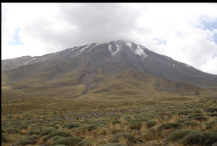
عکس های تزئینی