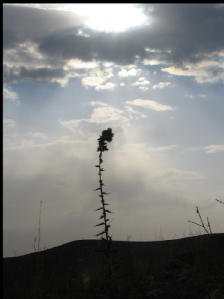
عکاس: اشکان رضوانی نراقی (عکس تزیینی)