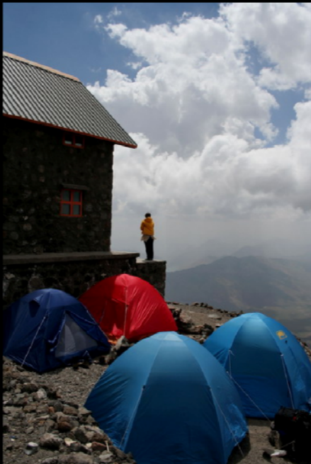
(عکس تزیینی)