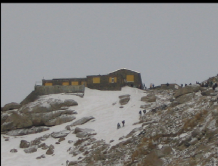
(عکس تزیینی)