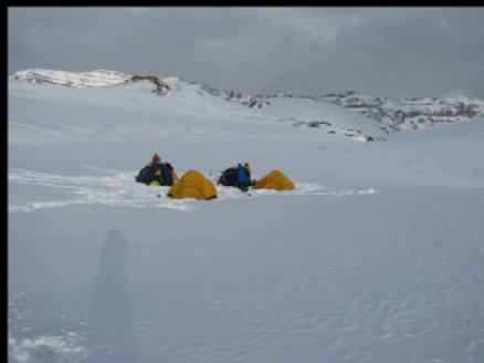
عکاس: اشکان رضوانی نراقی